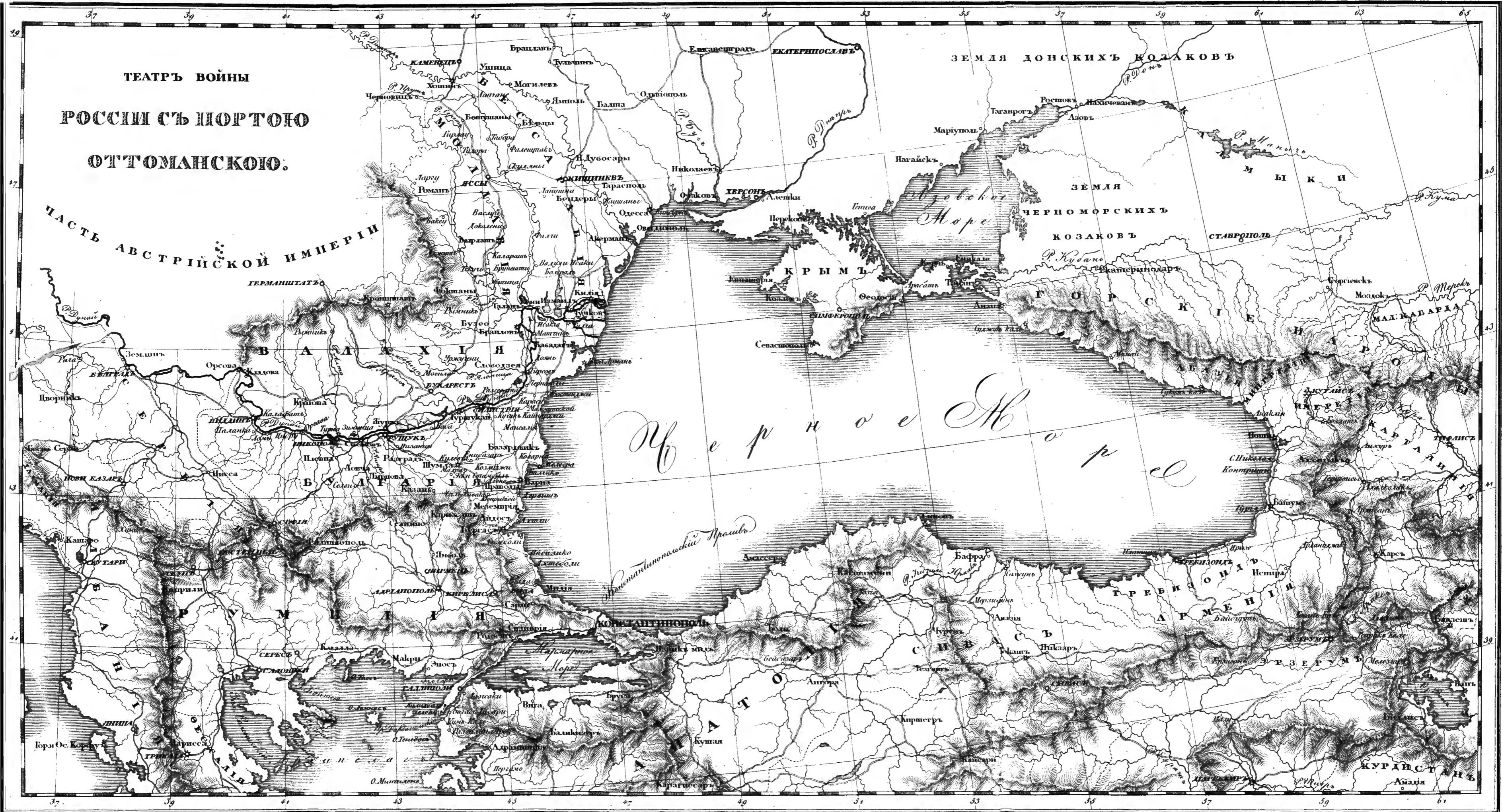
Российскія версты, 104 въ градусахъ. Турецкія Лазги, 22 въ градусахъ.